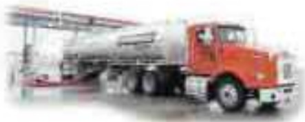
Contratista / transportistas