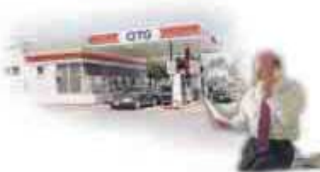
Retailers independientes de petróleo