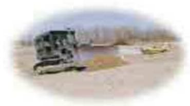
Vertederos y plantas de tratamiento de desechos

TLS - 2 de Veeder Root permite recolectar de manera sencilla información confiable y precisa de inventario y de entregas cuando se lo requiera.