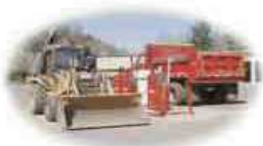
Operaciones de combustibles de la flota